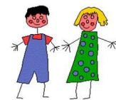
Ar paotr hag ar plac'h